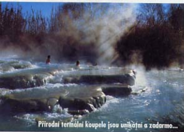
Přírodní termální koupele jsou unikátní a zadarmo...